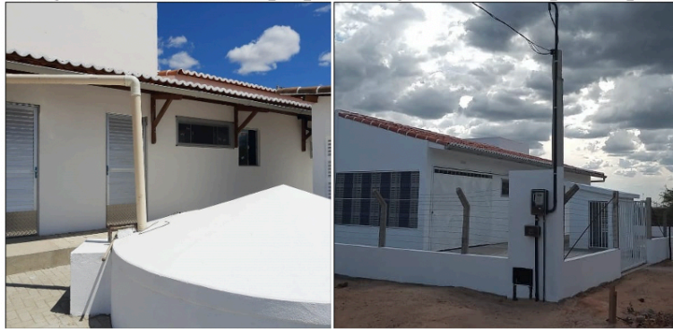
Figura 2 e 3. Casa de polpa entregue a rede Xique-Xique