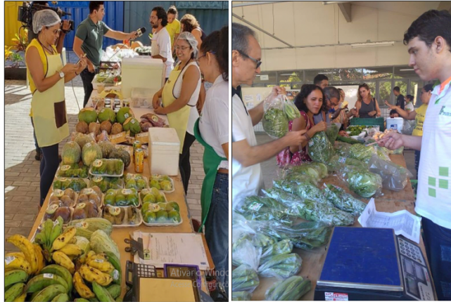
Foto 7 e 8 - Feiras da Xique-Xique dentro de condomínios em Mossoró e no IFRN – campus Mossoró