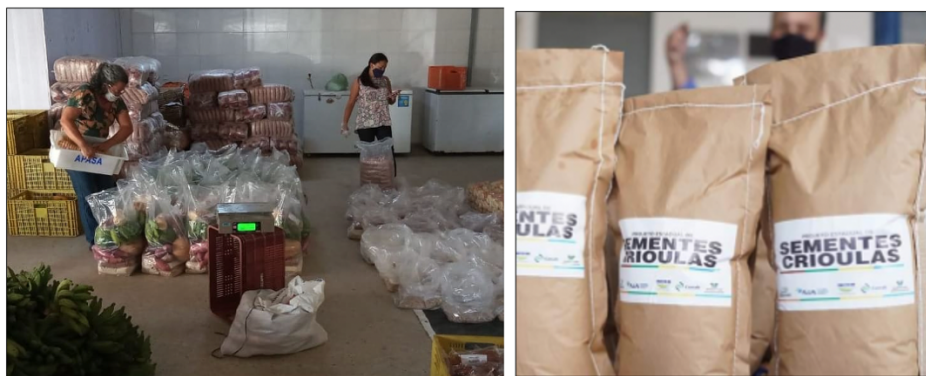
Figura 5 e 6 - Entrega de cestas básicas às comunidades quilombolas de 21 municípios do RN e sementes crioulas distribuídas pelo programa PECAFES