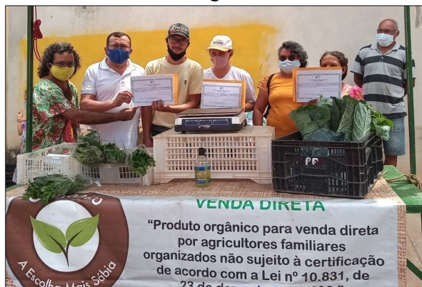
Figura 4 - Entrega dos certificados de produção orgânica a 12 produtores (as) do município de São Miguel/RN