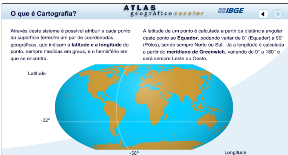
Imagem 1 - Mapa interativo para o trabalho com coordenadas geográficas.