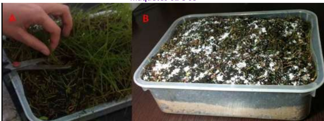
Figura 3: retirada da vegetação das maquetes 02 e 03; B- adição de sal nas maquetes 02 e 03