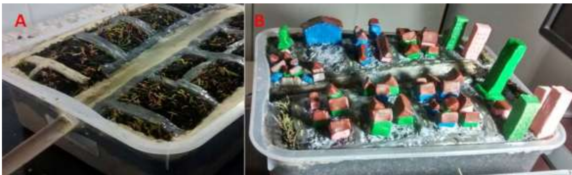
Figura 4 A- Inserção do cano de PVC e ruas de argila; B- inserção das casas e prédios de argila com cola branca