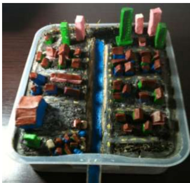
Figura 5 Maquete nº 3 finalizada