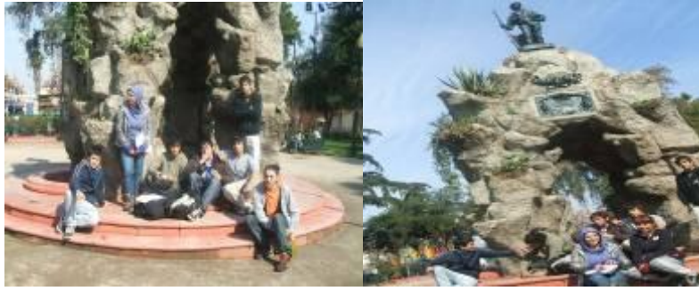
Figura 5: Monumento del roto chileno. Plaza Yungay . Santiago, Chile, 2009.