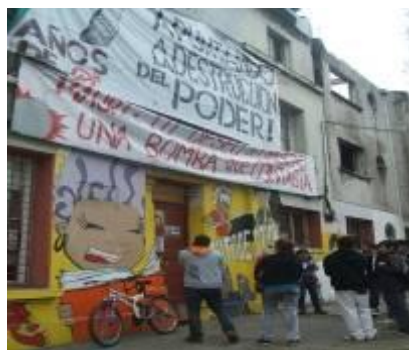
Figura 4: Centro Social Okupado Sacco y Vanzetti. Santiago, Chile, 2009.

Permanecer por un tiempo corto en este Okupa fue una experiencia que no había sido vivida antes por ninguno (a) de los (as) estudiantes presentes, por ende, al conocer un espacio que normalmente se criminaliza y que en el imaginario de algunos (as) acontecen las más fantásticas historias, fue una posibilidad de enfrentarse con otra realidad, con una forma de organización impensada, y al cerrar la puerta de esa casa las interrogantes fueron más que las certezas con las cuales los y las estudiantes se quedaron.