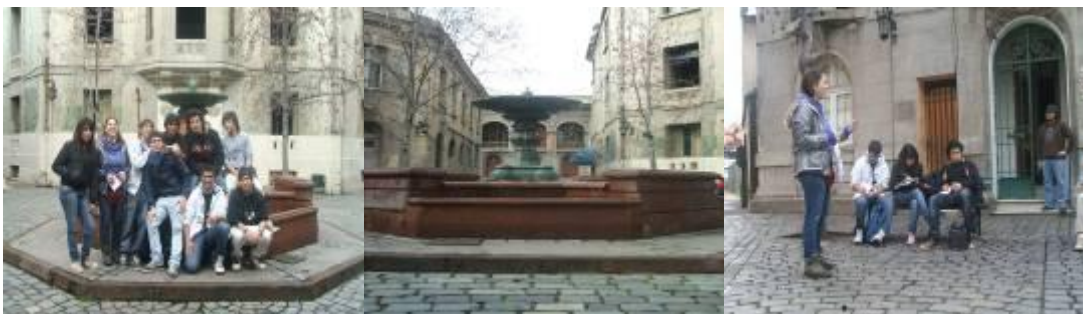
Figura 2: Plaza Concha y Toro. Santiago, Chile, 2009.

La observación, la apertura al dialogo, el cuestionamiento y la ejemplificación, permitió ir dando cuenta de cómo se construyeron en épocas pasadas y presentes espacios inclusivos que tenían un carácter privilegiado para algunas personas de nuestra sociedad.