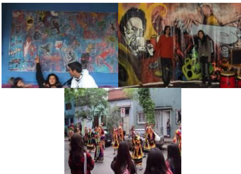
Figura 7: Centro Social Autónomo Cueto con Andes. Santiago, Chile, 2009.

Al reencontrarse posteriormente en aulas, fue necesario compartir e intercambiar las experiencias con los (as) demás compañeros (as) y poder presentar algunas fotografías y reflexiones en torno al tema. Se posibilitó además la discusión entre la relación entre lo experimentado y lo vivido en la propia ciudad en donde habitan, estudian y transitan a diario.