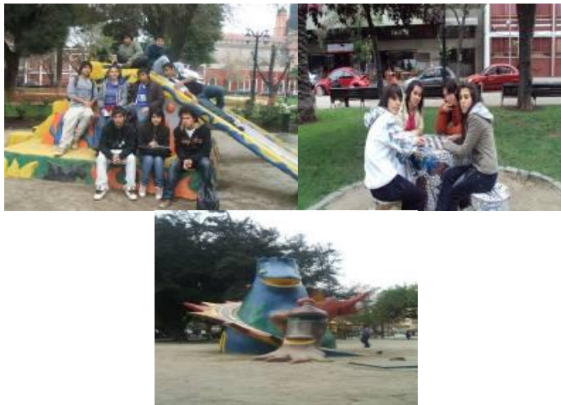
Figura 3: Plaza Brasil. Santiago, Chile, 2009.