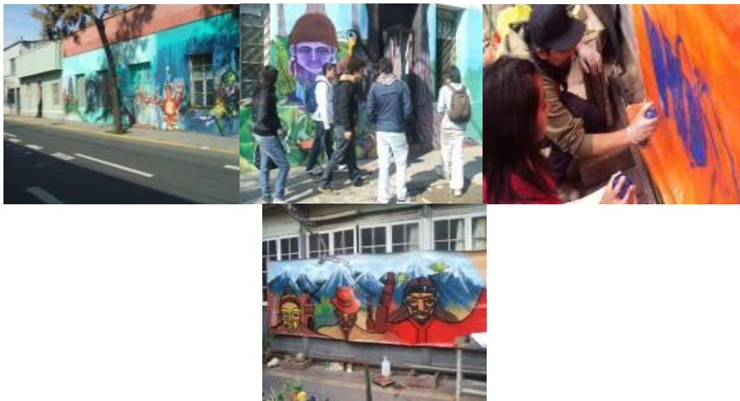
Figura 6: Centro Social Autónomo Cueto con Andes. Santiago, Chile, 2009.