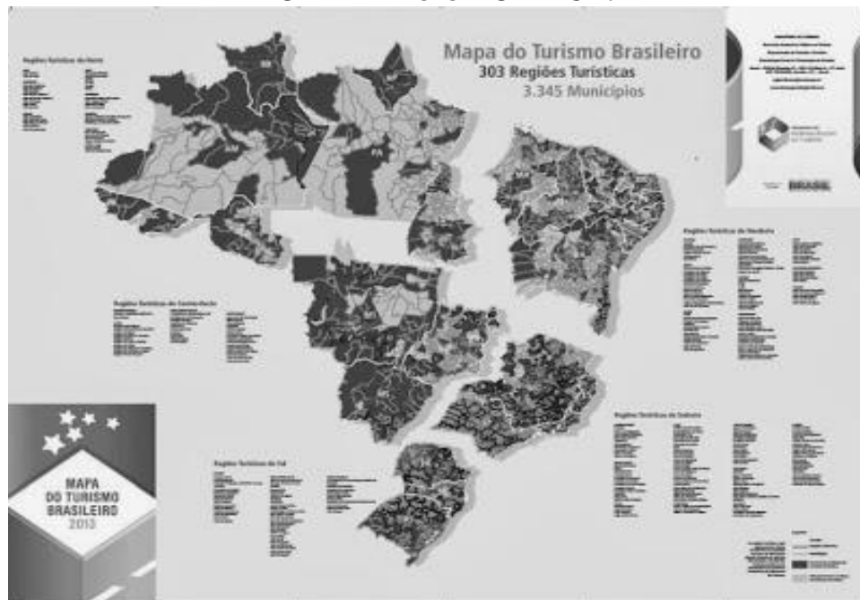
FIGURA 01 NOVO MAPA DO TURISMO BRASILEIRO DE ACORDO COM A PORTARIA 313 DO MTUR.