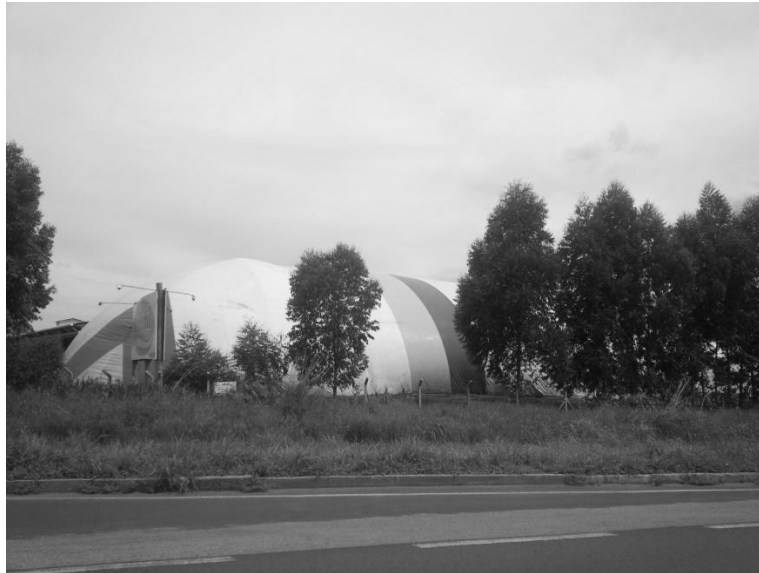
FIGURA 04 - SILO BOLSA NO MUNICÍPIO DE CATALÃO-GO.