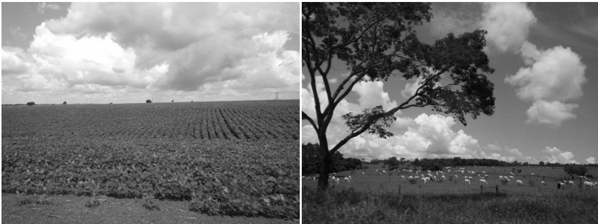
FIGURA 03: LAVOURA DE SOJA E PASTAGEM NOS MUNICÍPIOS DE CAMPO ALEGRE DE GOIÁS E IPAMERI.