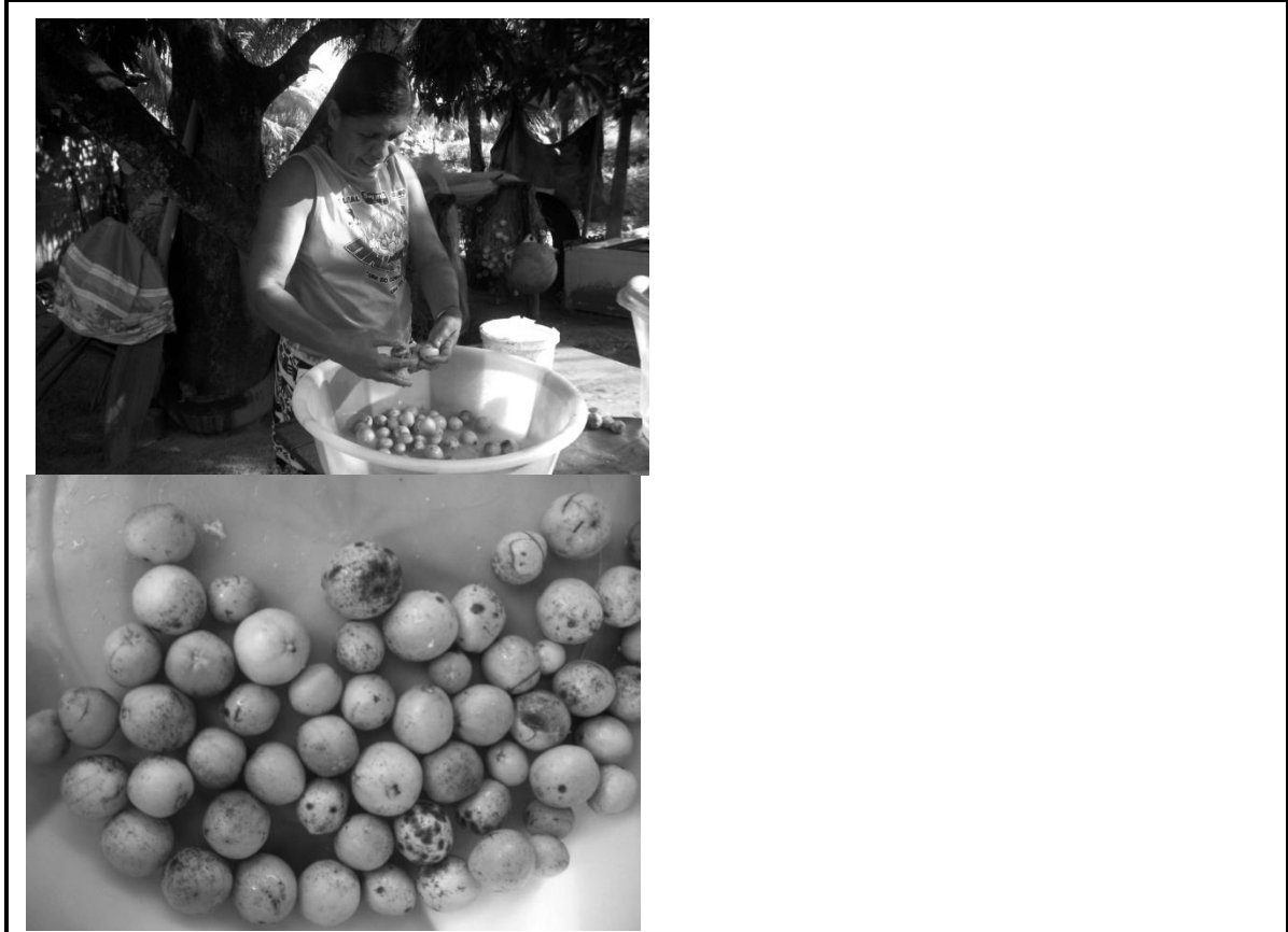
Figura 03- Pós-coleta: lavagem e secagem da mangaba. Pontal/SE

Os frutos colhidos são preparados para o beneficiamento (pós-coleta), que consiste na separação, lavagem, secagem e armazenamento destes. Nesta etapa a catadora trabalha sozinha ou tem ajuda da família, com a participação esporádica do marido (figura 03).