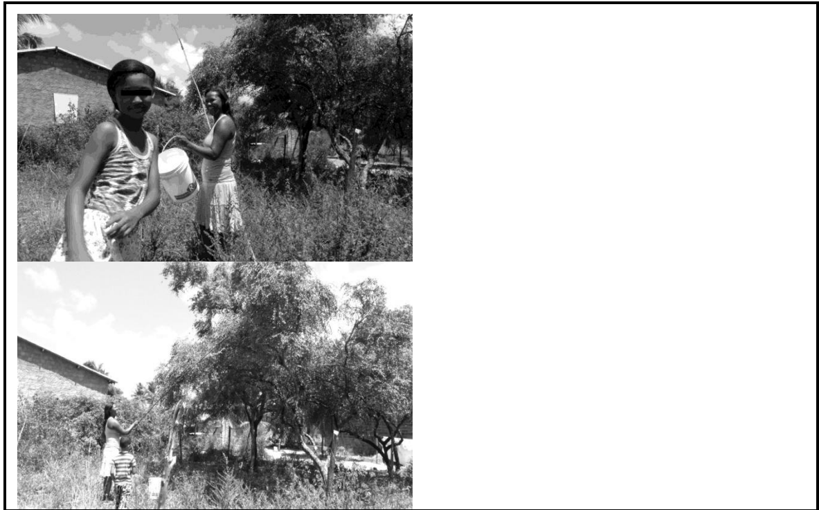
Figura 02- Participação familiar no extrativismo da mangaba. Pontal/SE

As mulheres envolvidas ao extrativo da mangaba desempenham paralelamente a pesca (no mangue e estuário), assim como prestam serviços domésticos nas casas dos veranistas, desenvolvem trabalhos temporários voltados ao turismo, vendem doces nas proximidades do cais. Enfim, elaboram estratégias para a manutenção do provimento familiar, sobretudo na entressafra, período de menor produção das mangabeiras.