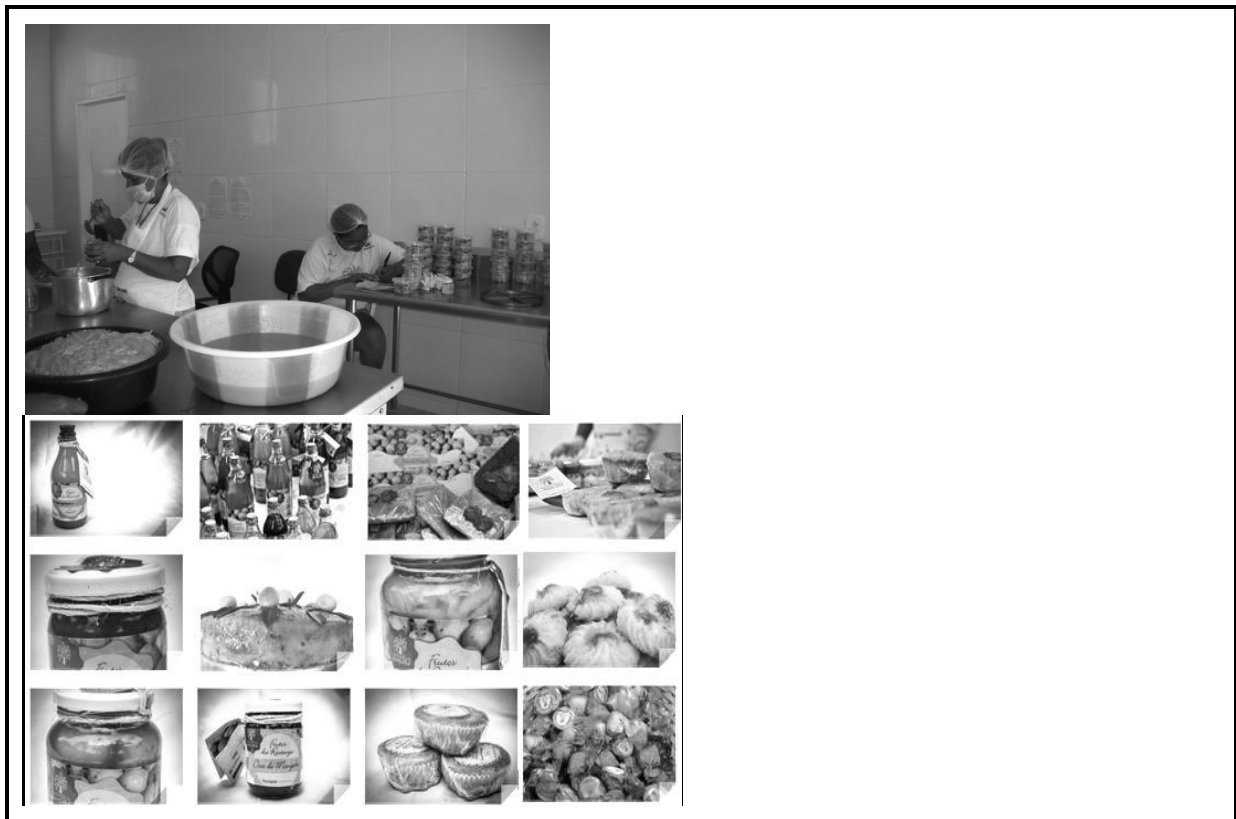
Figura 04- Unidade de beneficiamento em Pontal e produtos comercializados pelas catadoras de mangaba de Sergipe.

Na unidade de beneficiamento, a partir da oficina Noções de Boas Práticas e Segurança Alimentar e Nutricional, as mulheres tiveram a oportunidade de desenvolverem as receitas apreendidas dos seus antepassados (Figura 04). Hoje, elas produzem bolos, geléias, licores, biscoitos, torta, trufas, bombons, bala, compota, granola em três linhas de comercialização: frutos da restinga (alimentos produzidos à base de frutas da restinga sergipana- mangaba, cambuí, murici, araçá, cambucá), frutos de quintal (alimentos produzidos à base de frutas dos quintais produtivos das catadoras de mangaba- jaca, manga, caju) e frutos desidratados (alimentos desidratados com a tecnologia social do secador solar, sem aditivo de açúcares ou conservantes).