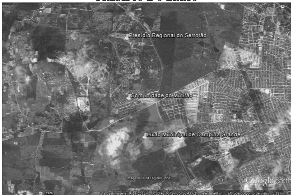
FIGURA 1: LOCALIZAÇÃO DA COMUNIDADE DO MUTIRÃO ENTRE O PRESÍDIO E O LIXÃO