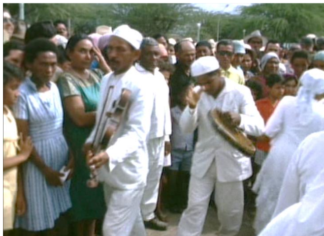
Imagem 2 – Representação de religiosidade popular: a Dança de São Gonçalo – Filme: A Visão de Juazeiro , Eduardo Escorel (1970).

No momento atual, a cinematografia de Juazeiro ganha uma leitura estética diversificada. Destaca-se neste período uma representação da cidade consorciada com sua experiência, ou seja, os sujeitos ausentes nas cinematografias anteriores passam a ser presentes nestas. Os sujeitos invisibilizados em representações consensuais da cidade (como a “cidade da fé e do trabalho”) são agora convocados a se insurgirem nos mesmo espaços, ou melhor, a repartirem destes espaços o direito à cidade (a “cidade das diferenças”), e portanto, de se fazerem presentes/visíveis nela. Ambulantes, travestis, homossexuais, figuras populares, sujeitos que