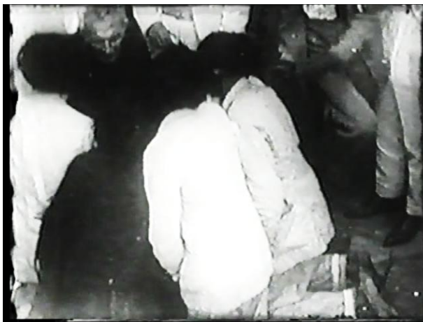
Imagem 1 - Pe. Cícero abençoando romeiros – Filme: Padre Cícero: O Patriarca de Juazeiro , A. Wulfes (1955).

Cícero como aporte de progresso e de primeiro “censor” de imagens 13 , aquele que concede o direito à imagem da cidade enquanto progresso e emancipação político-civilizatório, concedido, de direito, ao produtor das imagens fílmicas existentes e que vierem a existir a partir daquele momento. Entretanto, é o realizador Reis Vidal 14 que enxerga a cidade como um produto de reprodução para o lucro comercial, que cumprirá a mesma lógica até a década de 1950 com o registro documental de Alexandre Wulfes 15 (Imagem 1), outro realizador-produtor de imagens.