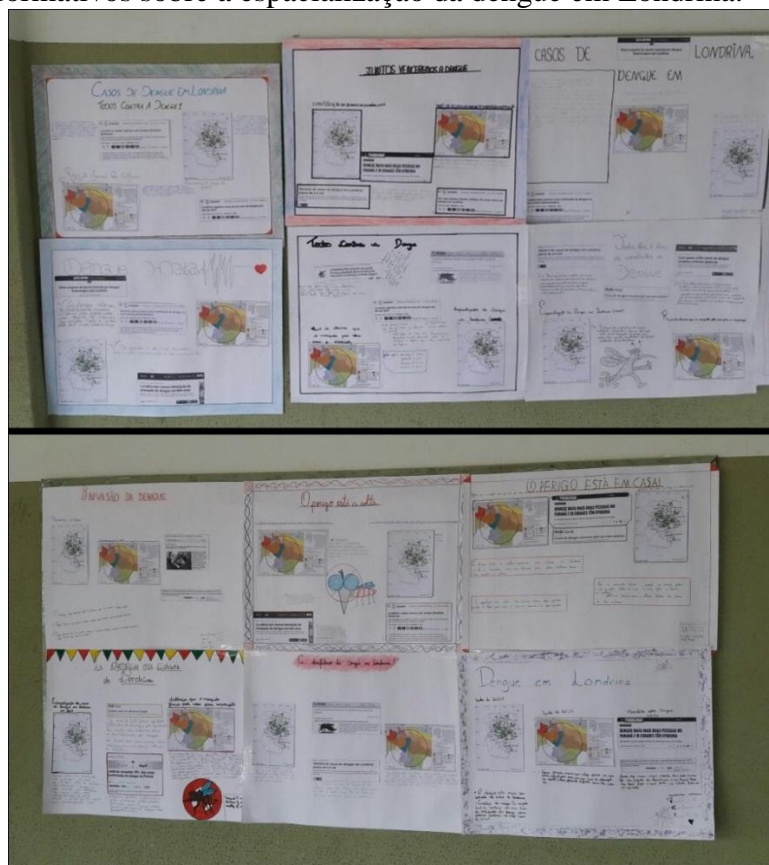
Figura 4 - Exposição no mural do Colégio Estadual Professor Paulo Freire dos cartazes informativos sobre a espacialização da dengue em Londrina.