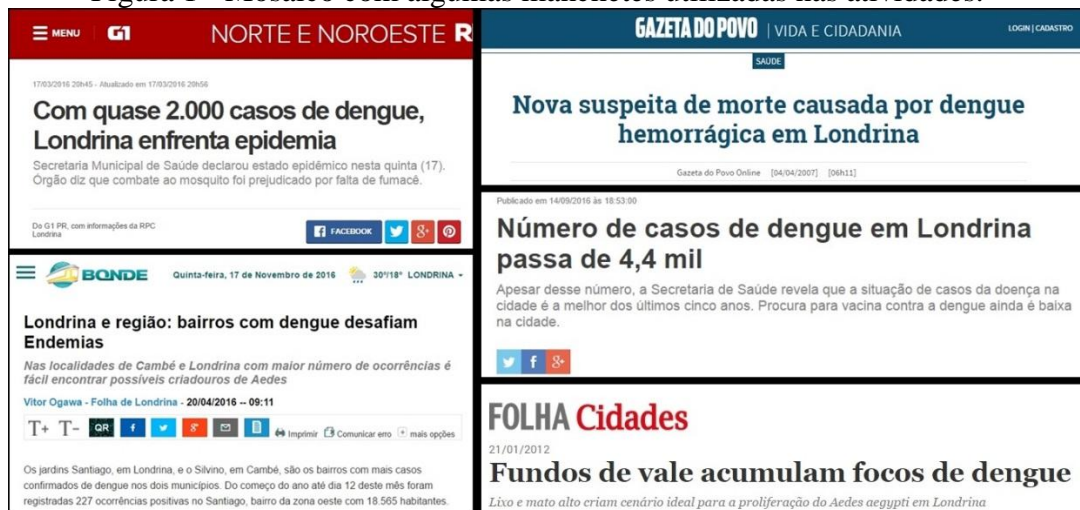
Figura 1 - Mosaico com algumas manchetes utilizadas nas atividades.