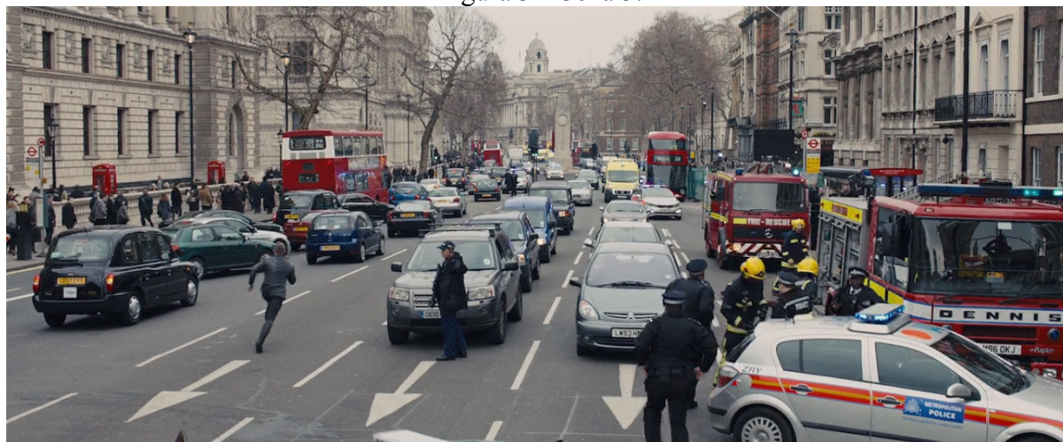
Figura 3 - Cena 3.

Fonte: 007 - Operação Skyfall. Nota: 01h 40min 24seg