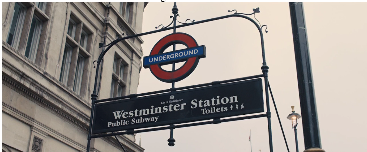
Figura 2 - Cena 2

Fonte: 007 - Operação Skyfall. Nota: 01h 40min 13seg