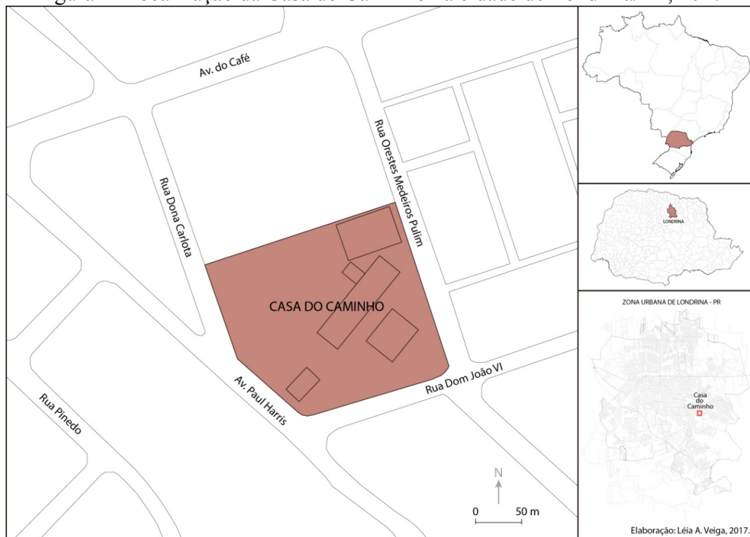
Figura 1- Localização da Casa do Caminho na cidade de Londrina/PR, 2017

A Casa do Caminho é uma instituição filantrópica religiosa, no caso espírita kardecista, cujo principal interesse é contribuir na educação de crianças e adolescentes. Localizada na zona oeste da cidade de Londrina, na avenida Paul Harris,1481, bairro Aeroporto, em Londrina – PR (figura 1), foi criada em 1987.