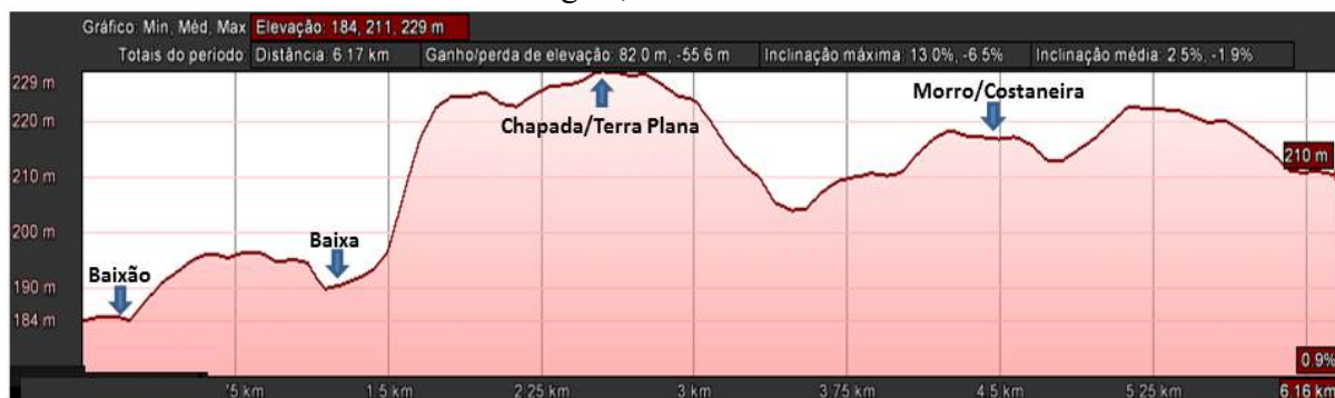
Figura 3 - Perfil topográfico da comunidade Carrapato, município de Santo Antônio dos Milagres, estado do Piauí