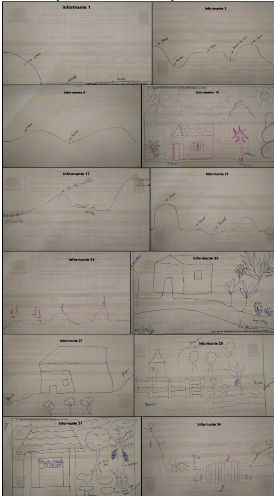
Figura 2 - Mapeamento comunitário elaborado pelos entrevistados da comunidade Carrapato, município de Santo Antônio dos Milagres, estado do Piauí